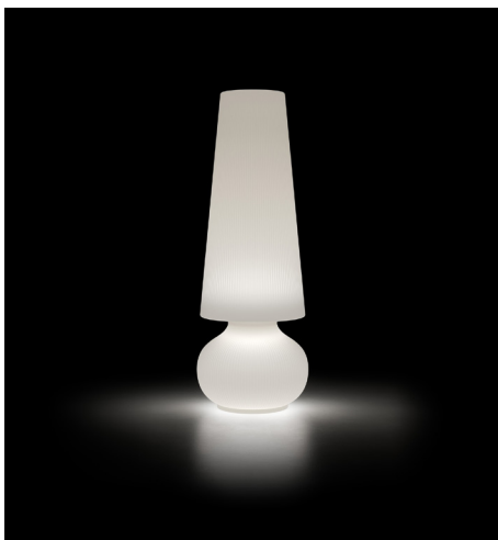
FADE LAMP M SCOPRI DI PIÙ