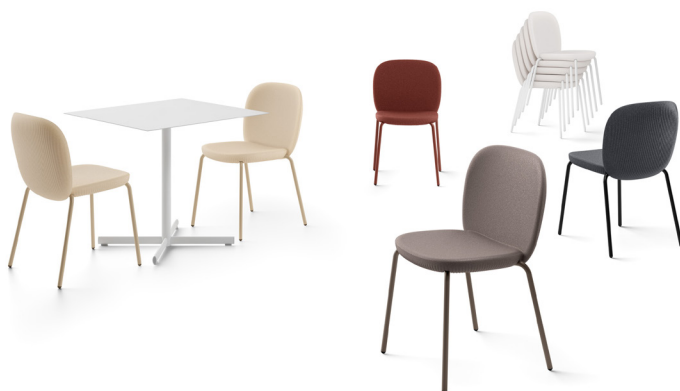
FADE STACK CHAIR SCOPRI DI PIÙ