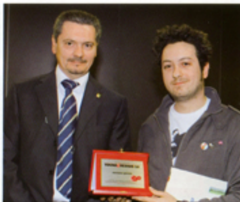
ALBERTO BROGLIATO Pouf GUMBALL prodotto da Plust Collection