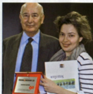
ELICA SARTOGO Portarifiuti GRAIN DE BEAUTÉ prototipo